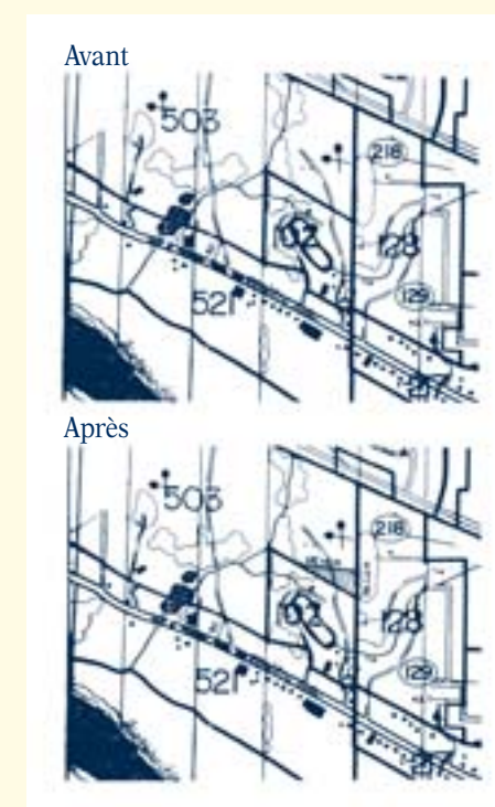
Croquis des zones visées 102 et 503

Donné à Ville de Sainte-Marie, ce 14 mars 2006.